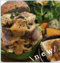
あさいろベーカリー asairo bakery