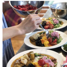
mucu 家のいつもごはん